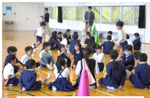
1年生歓迎会 (なかよしグループの活動開始です)